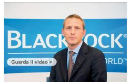
Analisi settimanale da BlackRock (Rovelli, 19 settembre) Tutti i video nella sezione Multimedia

Scegli il Certificate BNP Paribas che fa per te.