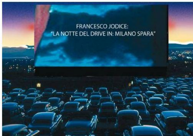
Francesco Jodice, La notte del Drive In: Milano Spara, 18 settembre 2013